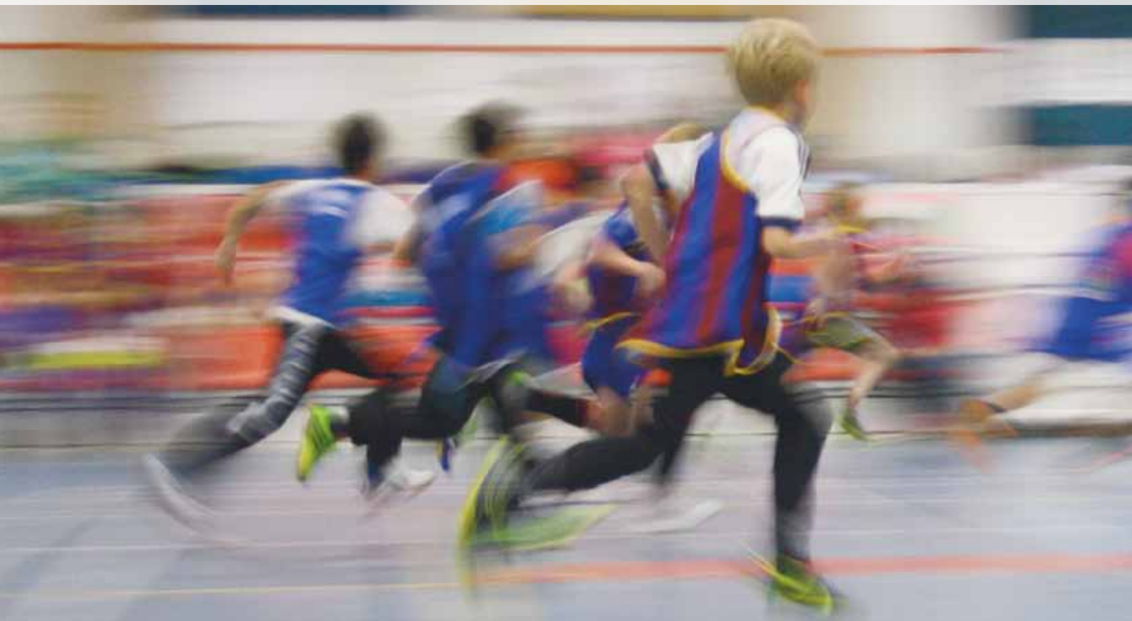
Nuuk, 2013

Kalaallit Nunaata tamarmi aningaaserivigimmatigut suliniutit Kalaallit Nunaata inerisarneqarneranut iluaqutaasut ulluinnarnilu atukkanut oqilisaataasut tapersersortarpagut.