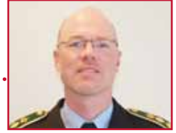
Bjørn Tegner Bay