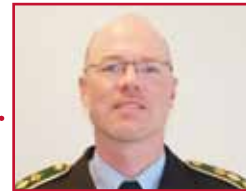
Bjørn Tegner Bay