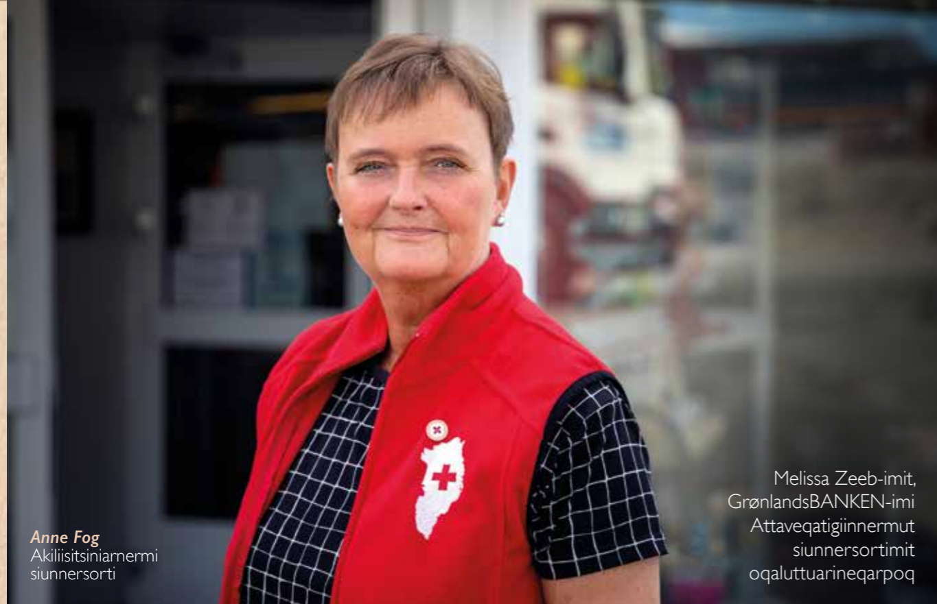
Anne Fog Akilisitsiniarmermi siunnersorti